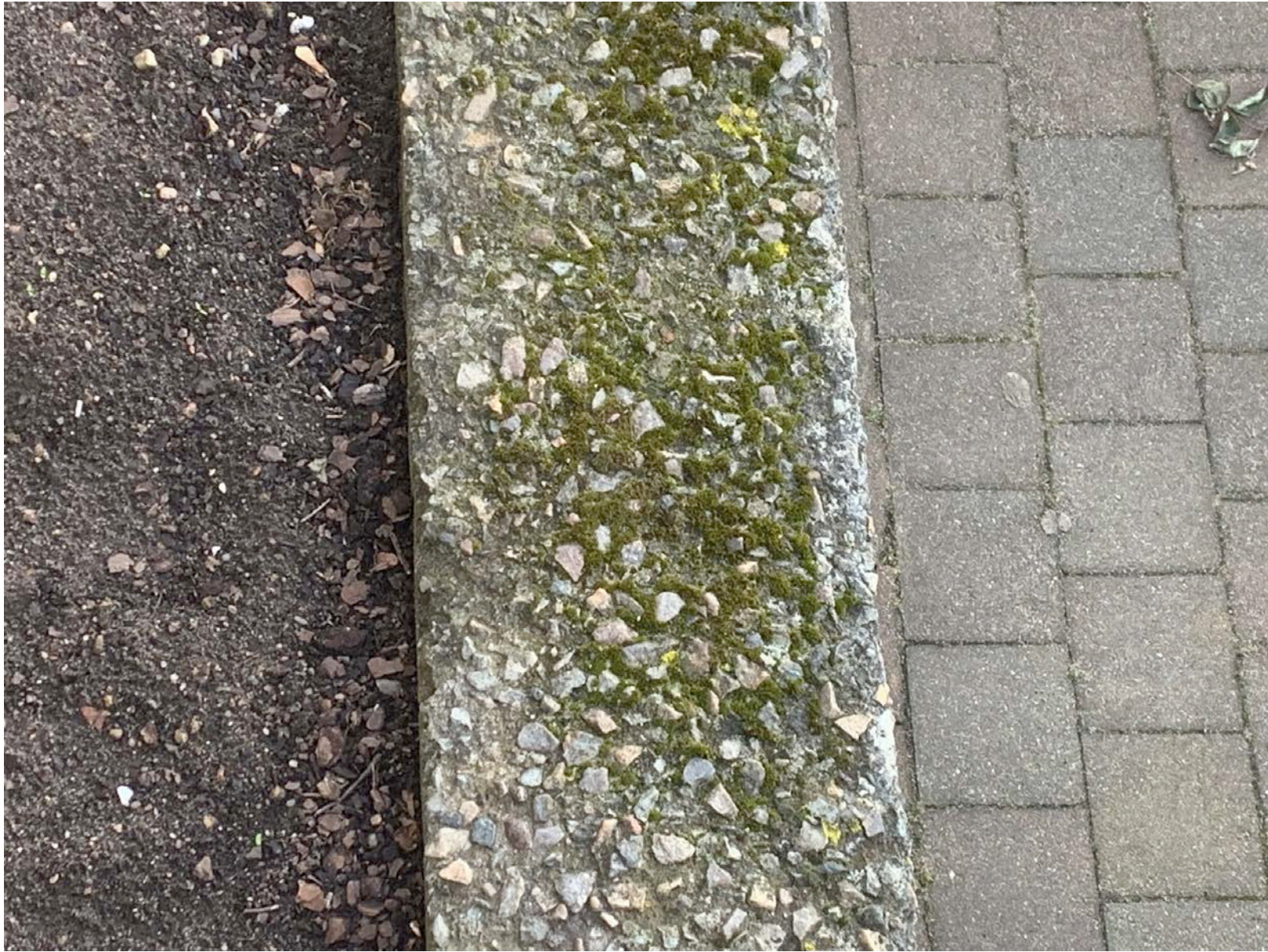
Gewinner Aufgabe 3 Lea Pallasch, Deutschland