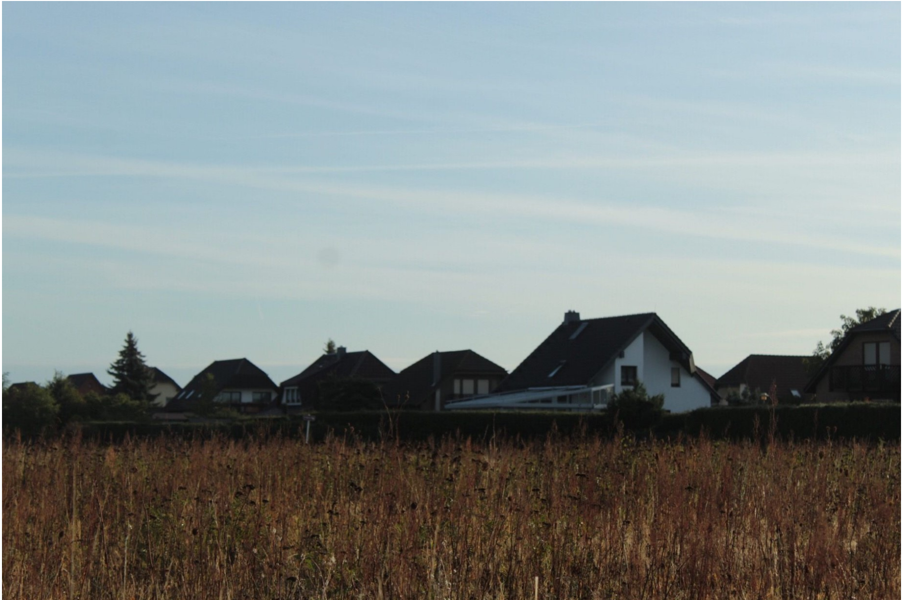
Gewinner Aufgabe 3 Alina Eisenbeis, Deutschland