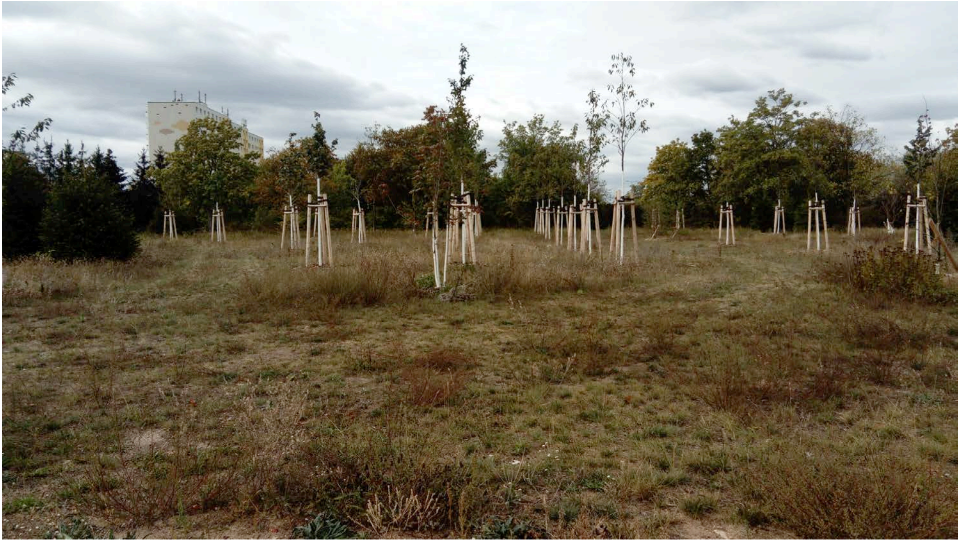
Gewinner Aufgabe 4 Marc Günther, Deutschland