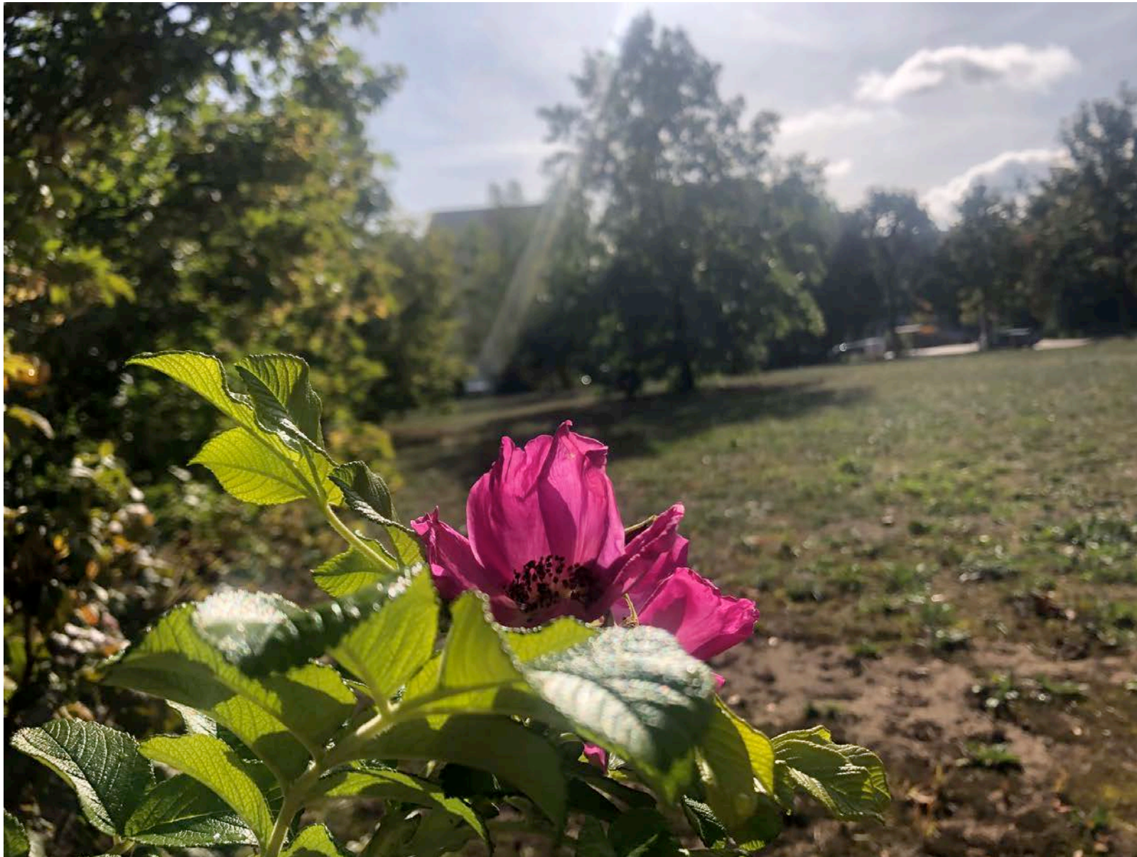
Gewinner Aufgabe 2 Rosalie Lange, Deutschland