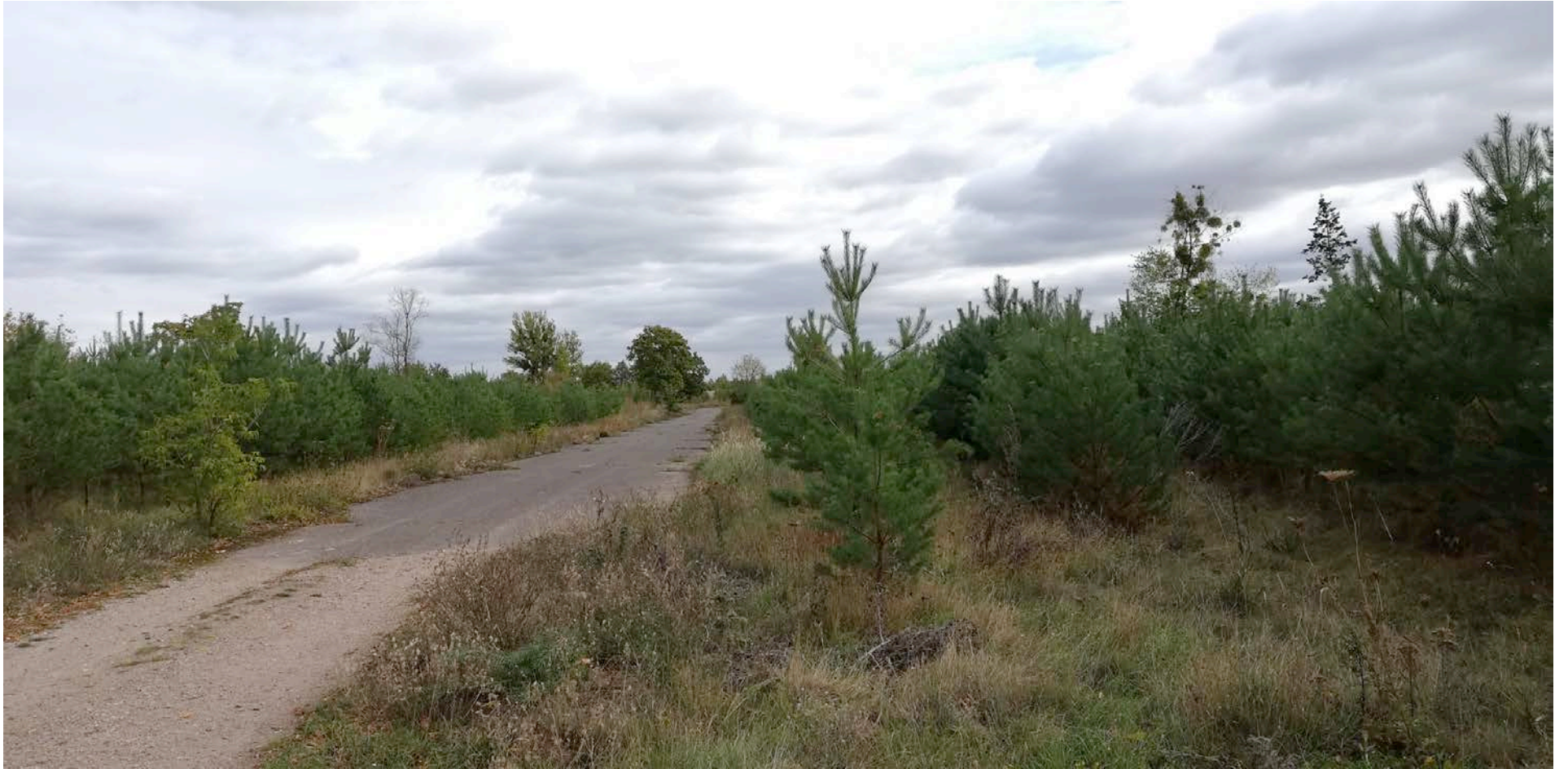
Gewinner Aufgabe 4 Andrej Bezrukov, Deutschland