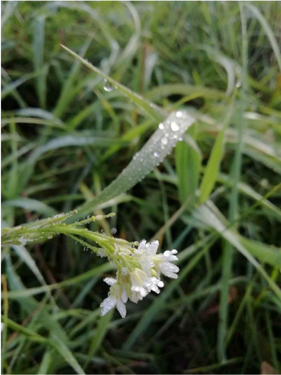
Gewinner Aufgabe 2 Saliha Wendlandt, Deutschland