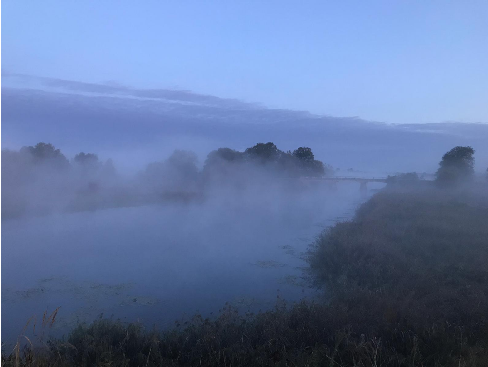
Gewinner Aufgabe 1 Pola Maslon, Deutschland