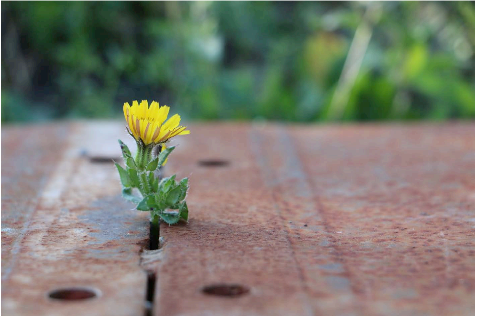
Gewinner Aufgabe 5 Ivana Nedeljković, Serbien