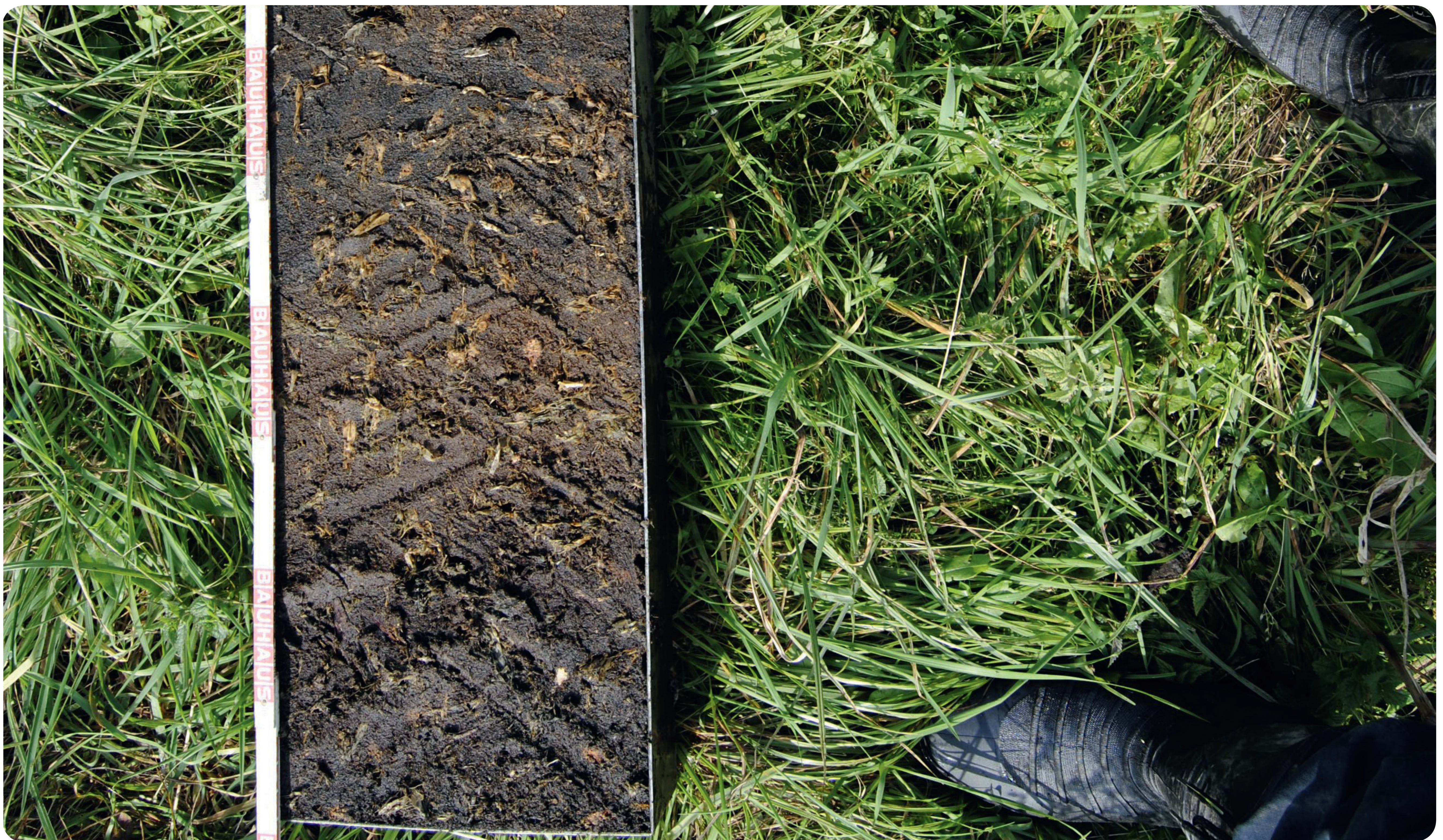
Bodenprobe aus dem Gamengrund bei Strausberg. Der Torf am unteren Rand des Profils ist mehr als 4000 Jahre alt!

Vermengen Sie torffreie Gartenerde aus dem Handel mit eigenem Gartenkompost, verbessert dieses Substrat zudem langfristig die Humus- und Mineralstoffversorgung im Boden und fördert das Bodenleben. Dies kommt dem Idealzustand eines gesunden Bodens auf nachhaltige Weise sehr nah!