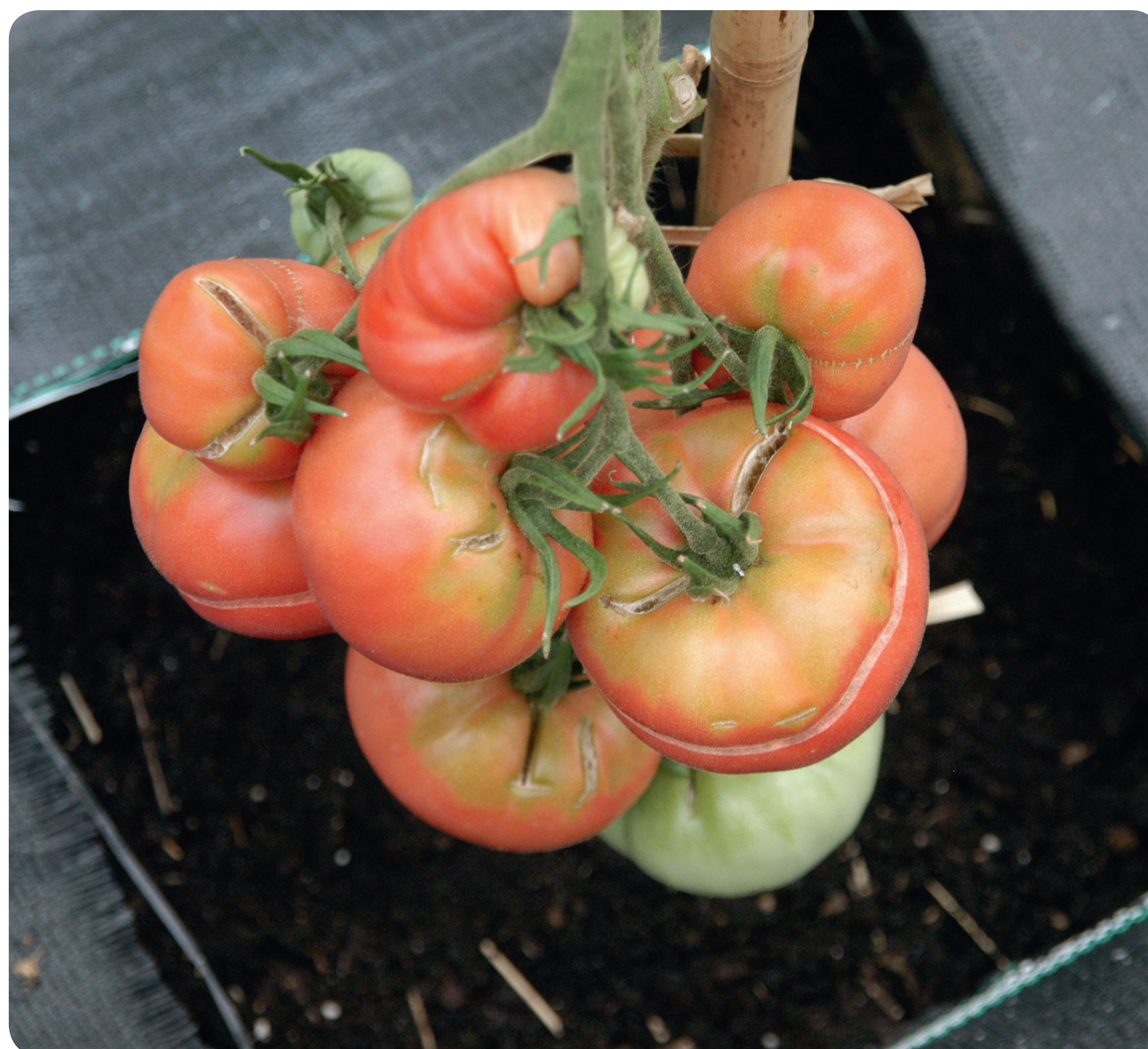
Blütenendfäule bzw. das Aufplatzen der Früchte an Tomaten entstehen bei Trockenheit bzw. einer unausgewogenen Nährstoff- und Wasserversorgung.