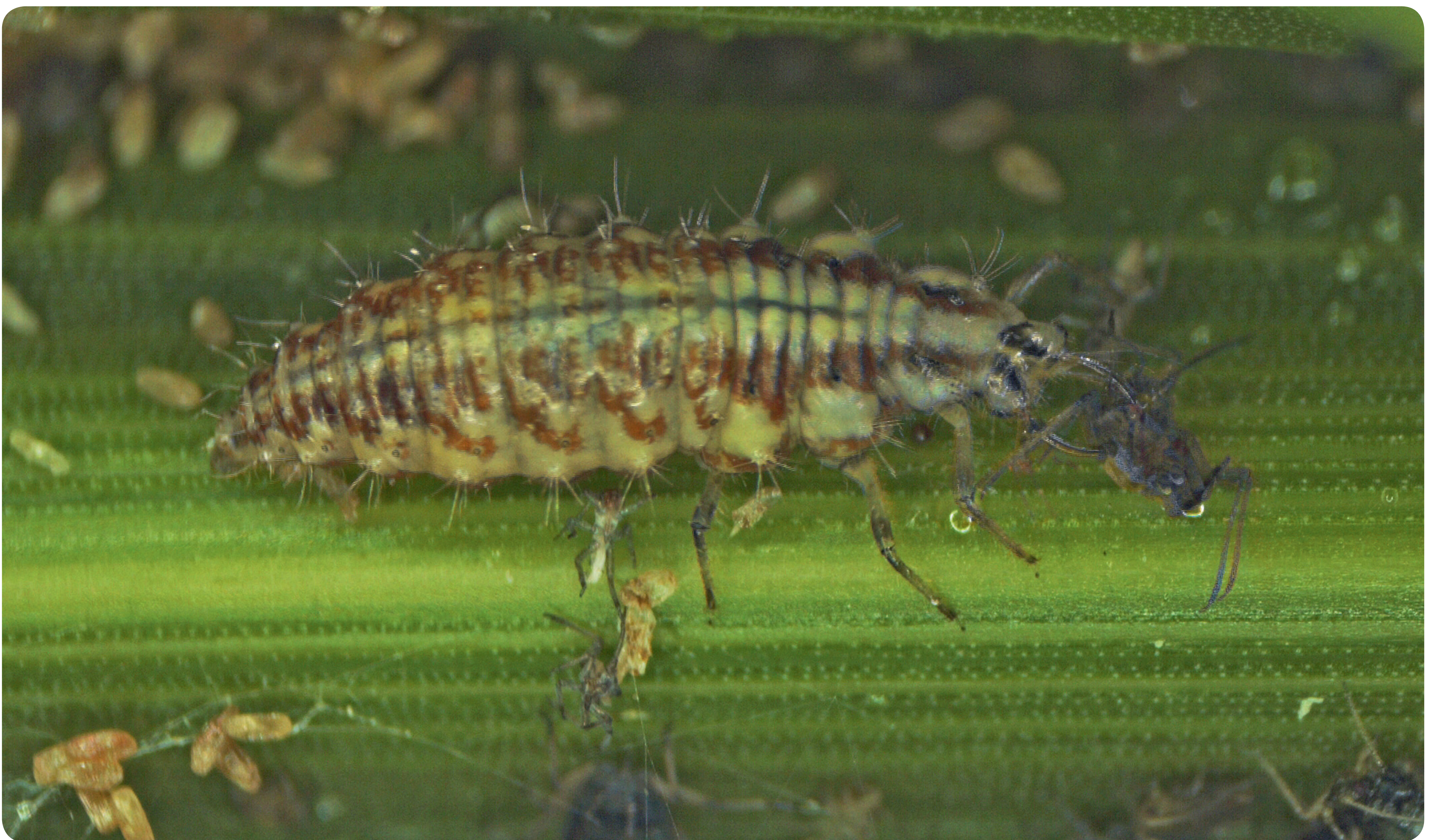
Die Grüne Florfliege ist ein filigranes hellgrünes Insekt. Ihre Larven können bis zu ihrer Verpuppung 500 Blattläuse vertilgen.

Lebensräume und Nahrungsangebote: Schlupfwespen parasitieren Traubenwickler-Puppen. Für die Larven von Marienkäfern, Florfliegen und Schwebfliegen sind Blattläuse eine wichtige Nahrungsquelle. Auch eine hohe Pflanzenartenvielfalt , „Bienenweiden“ und „Insektenhotels“, Nistkästen und Hecken als Brutplätze für Vögel, Laubhaufen für Igel und sonnige Steinplätze für Eidechsen machen Ihren Garten für die „Helfer aus dem Tierreich“ attraktiv.